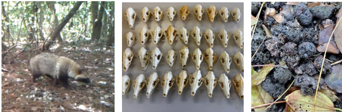
写真：石巻市に生息するタヌキ（左）、ロードキル個体の骨格標本（中央）、タヌキのため糞の様子（右） （写真はいずれも石巻専修大学・辻大和提供）

本研究チームは、宮城県石巻市で2020年9月から2025年10月に採集された多数のロードキル個体のタヌキを用い、下顎第一大臼歯と第二大臼歯の表面を共焦点レーザー顕微鏡（注4）で計測しました。さらに、同じ地域で行われた糞分析（注5）の結果と比較し、歯のマイクロウェアと季節ごとの餌内容との関係を調べました。