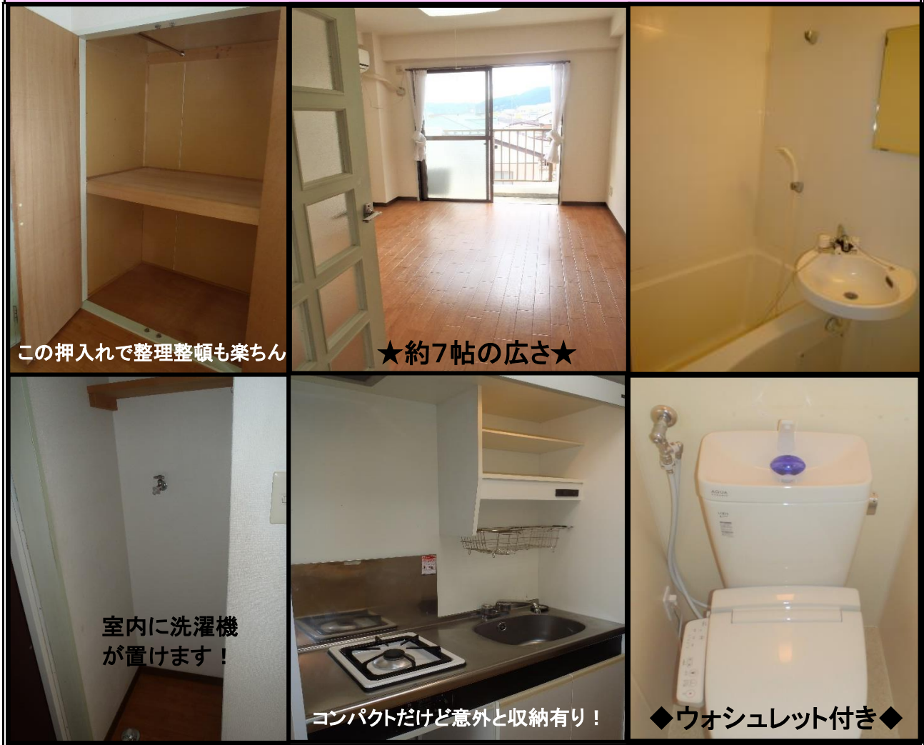
この押入れで整理整頓も楽ちん