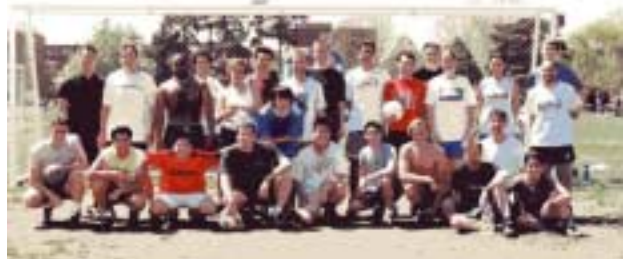
前列左から 3 番目が本人