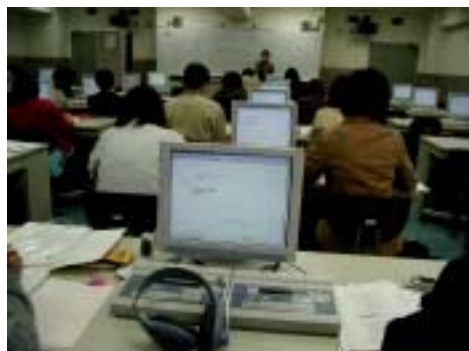
生田校舎 C 教室授業風景