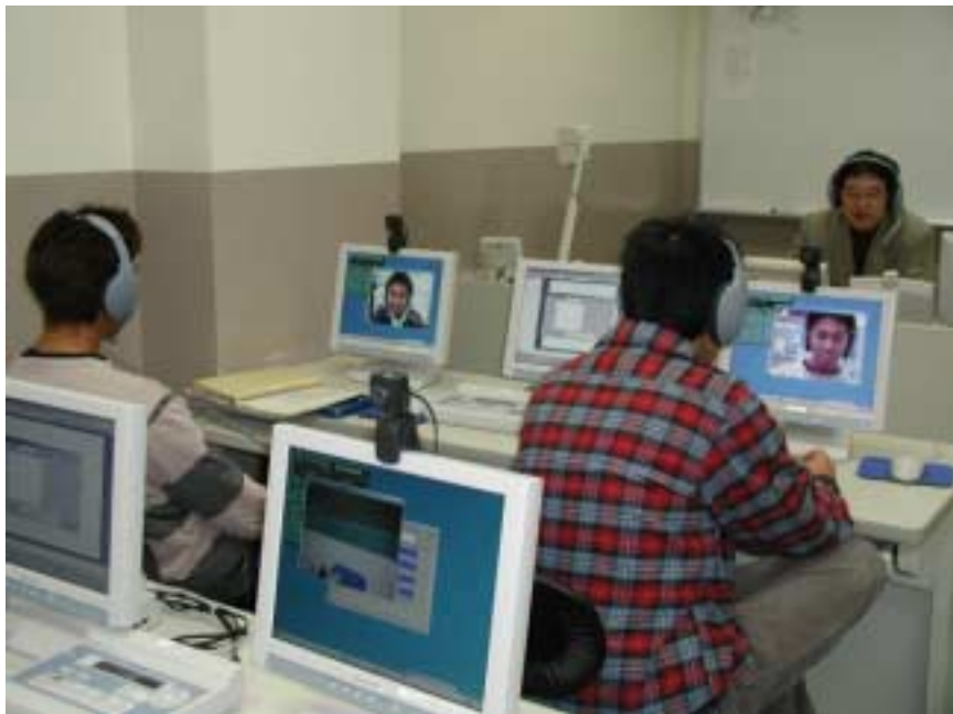
Face to Face 授業 (相手の顔を見ながらの会話練習)