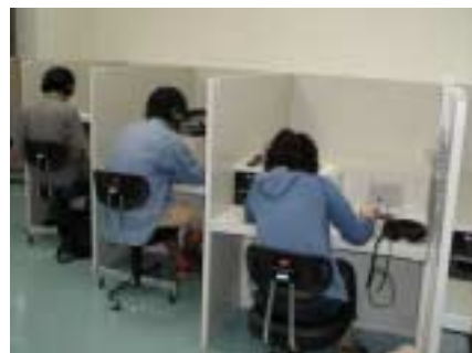
オーディオブースでの自習風景

授業での課題視聴、全世界対応のデッキでVHSテープ視聴、英字のキャプション表示による視聴が可能です。