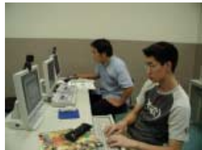
パソコンを利用した授業の風景

「LL 教室・自習室の LL 機器やパソコンの操作がよく分からない！」という学生は LL 事務室に申し出てください。説明を行います。また、機器の使用中に問題が生じた場合は、そのまま放置せず LL 事務室へ申し出てください。対処します。