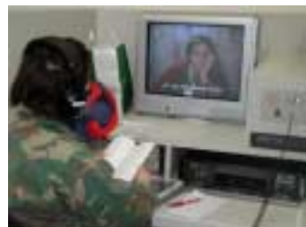
ビジュアルブースでの自習風景

今まで、教室と自習室を併用していたため、何かと不便な思いをしたこともあったことと思いますが、9月より専用の自習室が出来、利用者の皆さんに好評を得ています。この自習室には下記のブースが用意されており、それぞれのブースは個別に仕切られ学習に集中しやすいようになっています。また、最新のメディアを利用した自習が出来るよう機器も取り揃えています。是非一度覗いてみてください。皆さんの利用をお待ちしています。