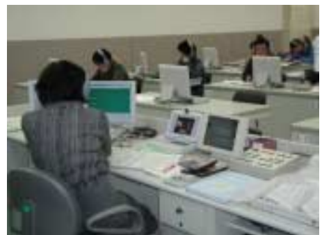
生田 LL 教室 C の授業風景

「LL 教室・自習室の LL 機器やパソコンの操作がよく分からない！」という学生は LL 事務室に申し出てください。説明を行います。また、機器の使用中に問題が生じた場合は、そのまま放置せず LL 事務室へ申し出てください。対処します。