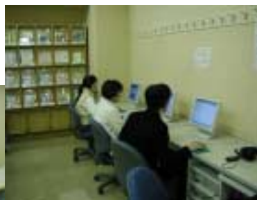
神田自習室パソコンブース