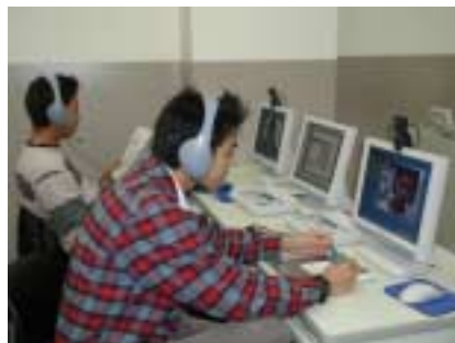
Face to Face 授業風景