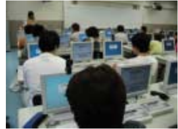
生田 A 教室授業風景

今後、授業担当先生による様々なマルチメディアを活用した幅広い授業が展開されていくことと思います。授業の予習、復習、あるいは課題などは LL 自習室を利用して学習してください。