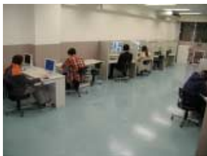
生田校舎自習室風景