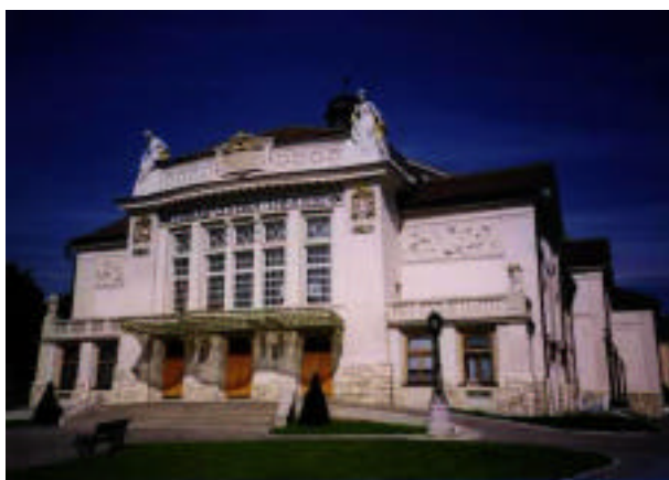
オーストリア・グラーツ市立劇場 (正面ファサードがユーゲント・シュティール様式)