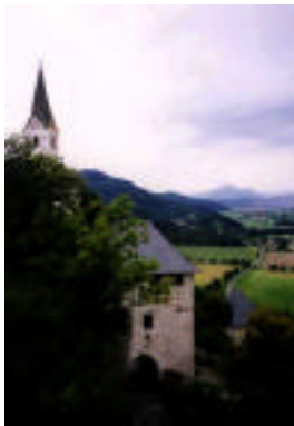
ホッホオスターヴィッツ城 (オーストリア・ケルンテン州)