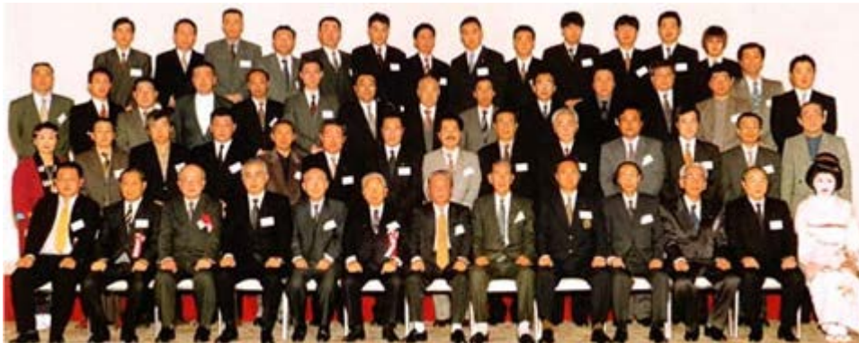
平成12年度・第44回支部総会(11月23日、ホテル・キャッセル)