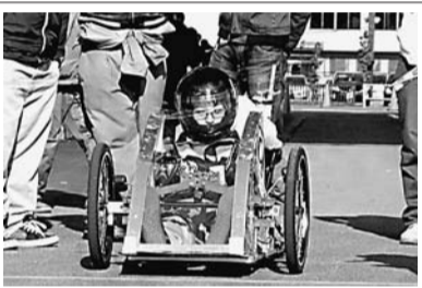
安定した走りを 見せた「黒王」号

日本自動車技術会東北支部が主催する「手作り自動車省燃費競技大会」が11月26日、仙台市の宮城県運転免許センターで開催された。