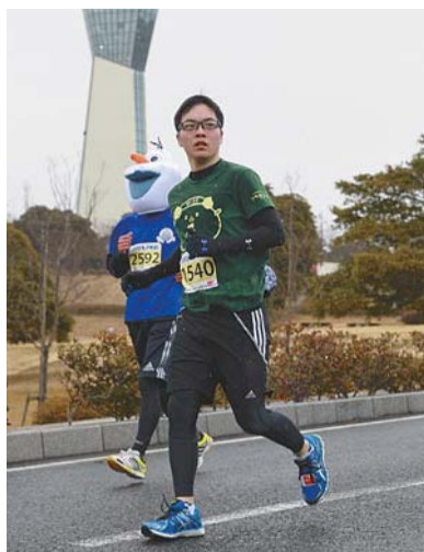
▲番組に先立ちいわき市で開かれたマラソン大会に出場。故郷の自然を味わいながら初挑戦でフルマラソンを完走した