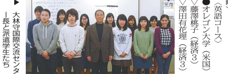
大林守国際交流センター長と派遣学生たち