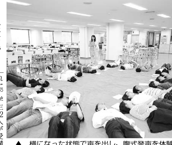
▲ 横になった状態で声を出し、腹式発声を体験

学生部が主催する「自己表現&ボイストレーニング講座」が9月16日、神田キャンパスで実施された。学生22人が受講し、音のこもった声を出し、腹式発声を体験した。 講師は、音のこもった声を出す方法を教える。音のこもった声を出す方法を教える。音のこもった声を出す方法を教える。