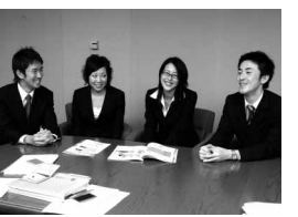
首藤ゼミ2006年度生の皆さん

「昨年度先輩たちが入選したので、今年05年度はプレッシャーを感じましたが、大学部門賞という大きな賞を頂いてほっとしています。副賞20万円も頂きました(笑)。多くの素晴らしい先生の下で、会計を勉強して視野が広がりました」