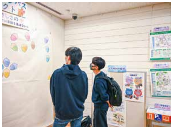
開催中の「やさしい、のカタチ展」

新学期、活気あふれる日常が始まっている。生田キャンパスでは今年度初めて、5月末までの期間限定でお弁当販売を実施。向ヶ丘遊園駅周辺の人気店3店が、サンドイッチや韓国料理、焼きそばなどを並べた。豊富なメニューと手ごろな価格が人気を呼び、売完の日が続いた。期間中は、学生生活支援プロジェクトとしてスキンケア用品配布会も行われ、長蛇の列ができていた。 天気の良い日は、輝く新緑の下で食事をする学生の姿も多く見られた。