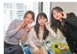
▲新入留学生を歓迎