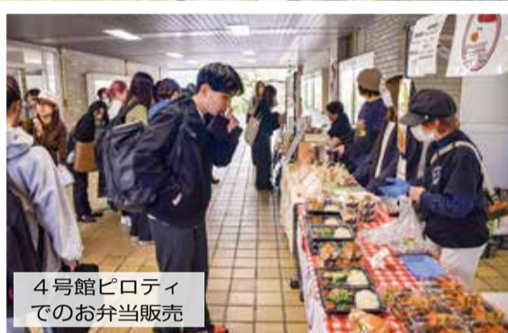
4号館ピロティでのお弁当販売