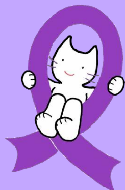
男女共同参画センターMIW みゆうじろう

「パープルリボン運動」は、世界を子どもや女性の暴力被害者にとってより安全なものとすることを目的として1994年アメリカ・ニューハンプシャー州の町で始まったといわれています。「パープルリボン」は、女性に対する暴力のない世界を望む気持ちを表す運動のシンボルとして、今では世界中に広がっています。