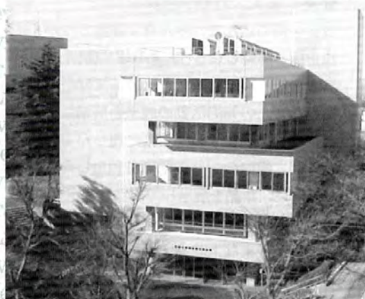
▲全面改修された生田分館