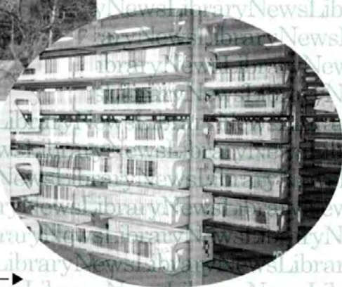
知的感性的遊戯空間 の実現に向け多数取り 揃えられた文庫本コーナー▶