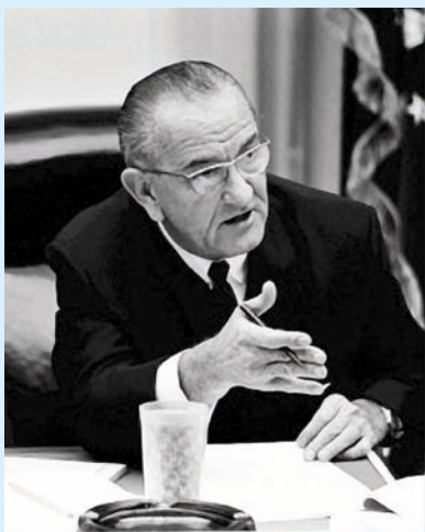
リンドン・B・ジョンソン 第36代アメリカ合衆国大統領

形 態：103 microfilm reels ; 35 mm + 5 guides (28 cm.).