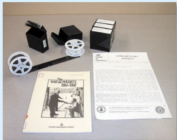
マイクロフィルム資料、他