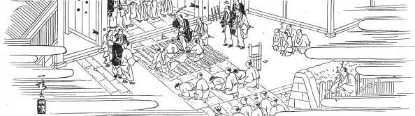
敲刑小伝馬町旧牢屋門前ノ真景（佐久間長敬著『刑罪詳説』1893）

【参考文献】高塩博著『江戸時代の法とその周縁：吉宗と重賢と定信と』汲古書院 2004