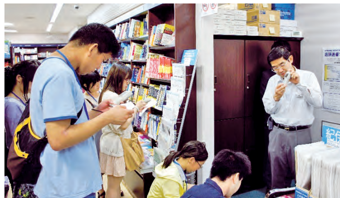
お店の方に機械の使い方を教えて選書開始！