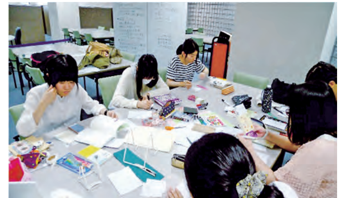
作業場所は本館 4F のアクティブラーニング・プラザです