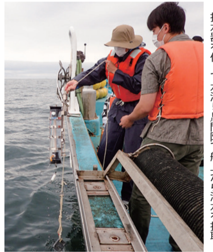
採水器を使って水深5m間隔で船上から海水を採取

海洋生物学実習 海洋生物学コースの3年次生23人は8月30日、9月1日、海洋観測や生物採集の基礎を学ぶ「海洋生物学実習」に参加。初