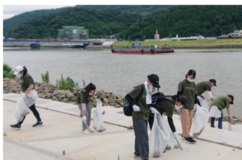
そろいのTシャツを着て、河川敷でゴミを拾う学生ら

「早朝からの活動で大変だったが、普段できない体験ができた。他学部の人と交流する貴重な機会にもなり、来年も参加したいと思う」と感想を語った。