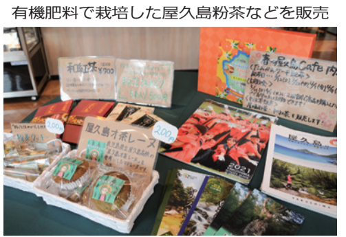
有機肥料で栽培した屋久島粉茶などを販売