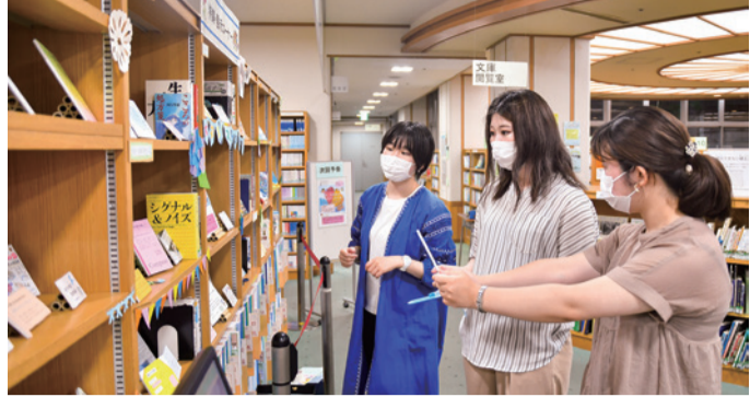
展示作業に取り組むCompassのメンバー

7月に川崎市立多摩図書館で開催された特集展示「今、大学生がオーストメしたい本」に図書館ボランティア「Compass」が協力した。展示コーナーにはメンバーが厳選した約100冊の本と、それを紹介するポスターなどを飾り、図書館利用者にとの出会いを提示した。