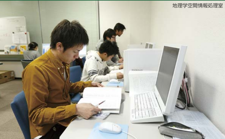
地理学空間情報処理室