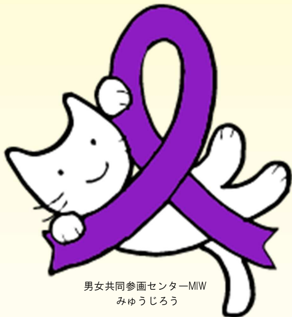
男女共同参画センターMIW みゆうじろう