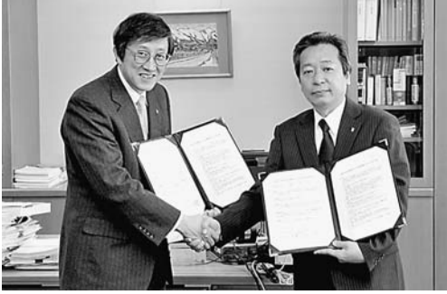
▲ 長船校長(右)と握手する日高学長