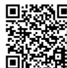
TOEFL ITP® テスト概要

https://www.senshu-u.ac.jp/global/ryugaku-abroad/#005