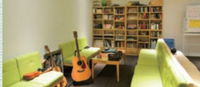
レクルーム Rec Room