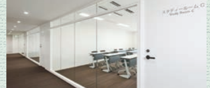
スタディールーム Study Rooms