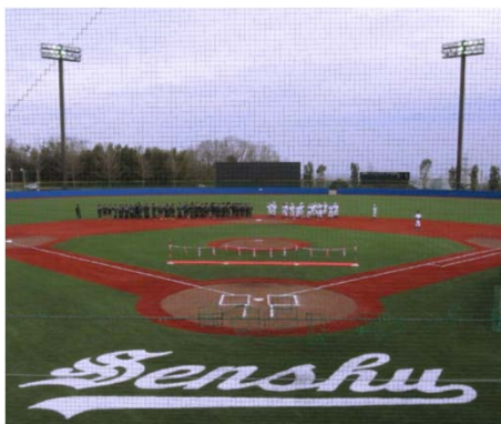
※写真は、平成27年3月に整備した野球場(伊勢原体育施設)である。

大学ホームページについては、コンテンツ更新の即時性と導線の最適化及びスマートフォン閲覧への対応を進める。