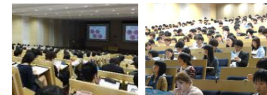
(オンラインで開催します)