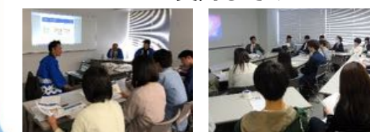
(オンラインで開催します)

受入先の担当者が、直接説明します。 興味のあるテーマの話しを聞き、 いろいろと質問してみよう。