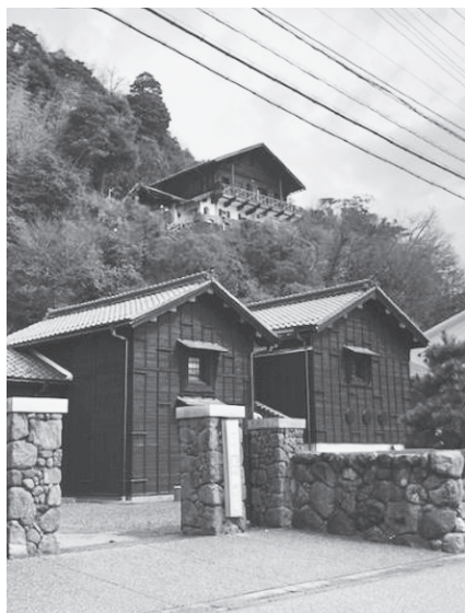
写真 3：海側の右近家入り口門と外蔵、 上方には西洋館写真

右近家の門を入ると、すぐの左手には観光案内所があり、右手には大きな土蔵が並んでいる。門構えを含む、これらの土蔵を中心に海に面して建てられた敷地部分は、背後の“河野北前船主通り”と名付けられた道を隔てて奥の山側に建てられた右近家本宅を海風から守るためにあるのだという。さらに本宅の背後には少し高台になったところに右近家別宅の西洋館（写真 3 の上方）もある。