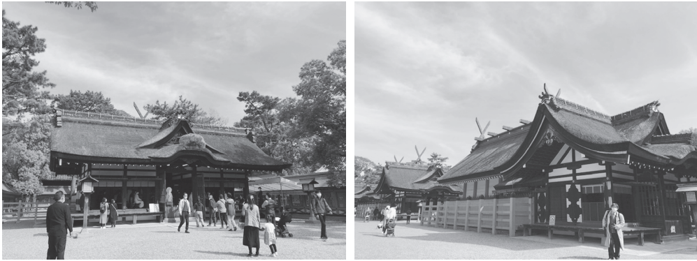
写真 11, 12 : 住吉大社第一本宮（左）と、第三本宮（奥に第二本宮）（右）

北前船に関する地域の神社にはほとんど船絵馬が奉納されているというが、航海安全の祈願と航海の無事を感謝するためのものであり、この船絵馬の専門絵師がいたのが大阪であった。2019年の夏季実態調査：北前船 Part3 で訪れた富山の港町東岩瀬にある北前船廻船問屋森家の館内にも大阪の絵馬師「絵馬藤」による船絵馬があり、描かれた船は四十物屋仙右衛門所有の清正丸であった。また、今回の実態調査初日に訪問した加賀橋立の北前船の里資料館（酒谷家）にも大阪の絵馬師「吉本善京」の手になる船絵馬が所持されていた。船絵馬には背景に住吉大社が描かれているものが多くあるという。通常、船絵馬には船主の船が描かれる。そこに守り神のように描き込まれたのが住吉大社だったのであろう。そして現代でも、住吉大社の授与品のなかには商売繁昌のご利益がある宝船絵馬と大漁旗があり、大社信仰が受け継がれていることがわかる。