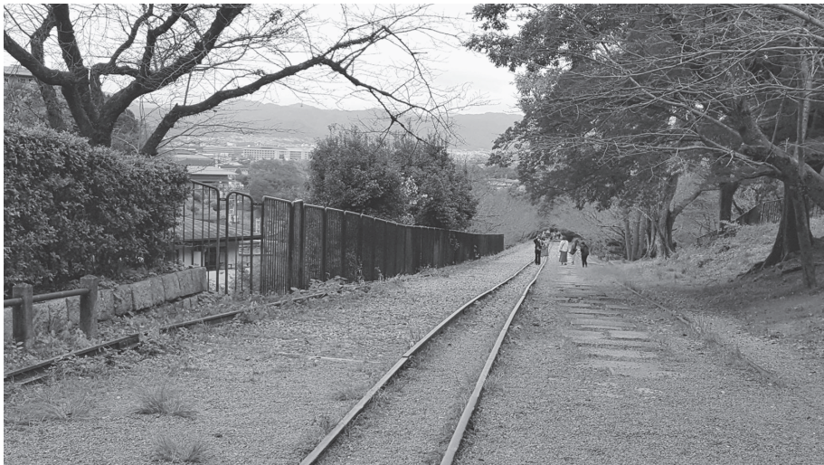
写真8：インクライン跡（蹴上舟溜り側から南禅寺舟溜りに向かって撮影 ※別日撮影）

向かって歩いていく。下り坂の上にレールと敷き詰められた石がごろついて意外と歩きにくい。それでも顔を上げれば左手には蹴上げ浄水場や今も運転している蹴上げ発電所の古い煉瓦造りの建物を見ることができる。さらにこの日は、インクラインの線路上の両脇に植えられた桜の