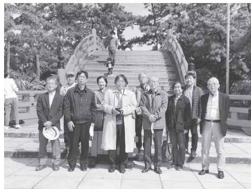
写真 13 : 住吉大社、鳥居と本宮をつなぐ大社のシンボル“反橋”の前で集合写真

これまでの北前船をめぐる訪問地での見聞がここ住吉大社に結びつくことこそ北前船の足跡をたどる調査の最終地にふさわしい場であることを示しているようであった。