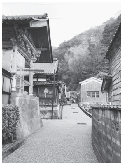
写真 4：金相寺脇から山側を見る