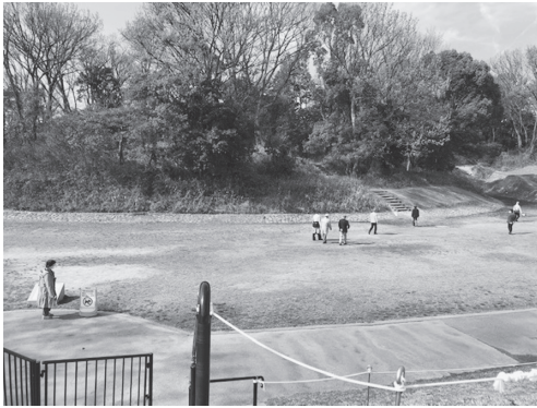
写真 9：前方後円墳の後円沿いを歩く