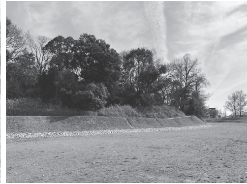
写真 10：青空に映える墳丘と内濠

やジオラマ、映像で分かりやすく再現・解説されていた。次の行程のために歴史館の滞在時間は30分ほどしかなかったのだが、古代体感ミュージアムとうたわれているだけあり、展示は興味深く、もう少し時間の欲しい場所であった。