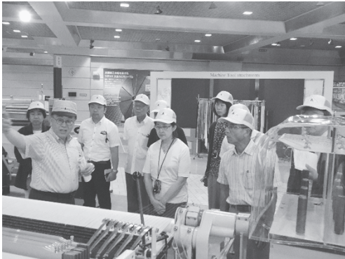
写真 20：ショールームで新旧織機の説明を受ける