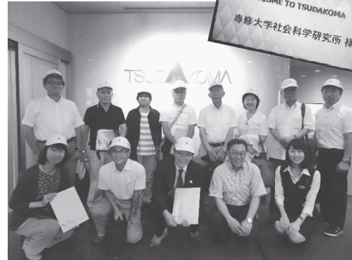
写真 21：津田駒での記念撮影

お話をうかがった後、広い構内のなかの工場の一部を見学し、ショールームにも案内された（写真 20）。津田駒工業の初期の織機から最先端の織機の実物が展示されており、特に現在の主力製品であるジェットルームの動きと早さに参加者からは声が上がった。