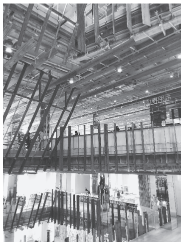
写真 10 : 富山キラリ内の市立図書館階

富山市役所でうかがったお話をもとに、午後からは“富山市コンパクトシティ”を体感するために、路面電車に乗り、中心市街地を歩き、LRTにも乗車し郊外まで足を延ばして実際に歩いてみることにしていた。まず、私たちは路面電車の停車場“大手モール”でバスを下車し、賑わいを創出するために道路空間を利用してさまざまなイベントを実施するトランジットモール社会実験が行われているという実施空間 (= “大手モール”) を 150m ほど歩いた。この日は実験日ではなかったが、路面電車の走る道路は思ったよりも広く、容易に広場へと展開しやすいような空間であることが確認できた。そこから 5 分ほど南に向かって歩き、東に曲がると全天候型多目的広場“グランドプラザ”(H19 年オープン) が右手に見えてきた。市役所では稼働率が年間 92.9% (休日は 100%) と聞いたが、当日は平日昼間であったためであろう、特にイベントは行われていなかったものの天井の高い (19m) 広々とした空間と、その北側上方には大型映像装置があった。隣には大和デパートがあるためか人の流れもほどよく、あちこちに置いてあるカフェテーブルにはお弁当を揚げたり新聞を揚げたりして気ままにくつろぐ市民の姿があった。グランドプラザは北から南に抜けられるようになっているため、北側から到着した私たちがこれを南に抜けると左手にガラス面の建物“富山キラリ”が見えた。建物外装はガラスとアルミと御影石が組み合わされたものであり、様々な角度で反射されることによってキラキラとしたイメージが放たれた外観はまさしく(先にも述べたように葉ビんに始まる)ガラスアートであった。また富山県産の木材が使用されているという内部は自然のあたたかさや落ち着いた雰囲気演出していた(設計は隈研吾氏)。建物内には「ガラスの街とやま」を目指したその