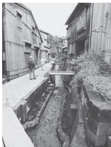
写真6：宿根木の家並み

その後、バスで宿根木のまち(町並み保存地区・宿根木)へ移動し、自由行動で歩いてみることにした。近世の廻船業としても造船業としても、必要であったに違いない「密集性」に特徴付けられた集落形態がみられた(写真6)。宿根木の説明によれば「約1ヘクタールの土地に百十棟の建造物を配置する高密度」とあり、石畳の狭い道を歩くとまさにタイムスリップして踏み込んでしまったような街並みがつづく。テレビドラマなどでよく見かける「三角家」(写真7)は密集した町の谷間に工夫を重ねて地形に合うように建てられた家であった。かつての町の