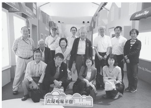
写真 9 : YKK での全員集合写真