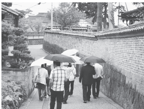
写真1：かつての鉱山町「上町」を歩く

その後、見学中に強くなってきた雨をしのぐように相川の山中にぼつりとある金山茶屋で温かい昼食を取り、激しくなる雨の中、金山を後にした。