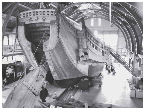
写真5：板図から再現された北前船“白山丸”を舵のある船尾から

宿根木にある佐渡国小木民俗博物館を訪問したのは当時の実物大の北前船が展示されている