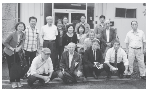
写真4：セイデンテクノ社屋前での記念撮影