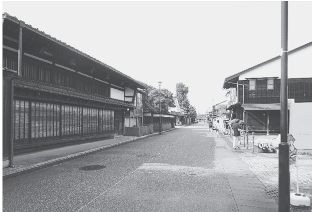
写真 13：左手森家に面した岩瀬新町通り（空が広い）

並みではあるが、当日の青空の下、新しく美しいまち並みの印象が強く残った（写真 13）。誘導サインも整備されており、今後はさらに観光地としての整備が進むのではないかと思われた。