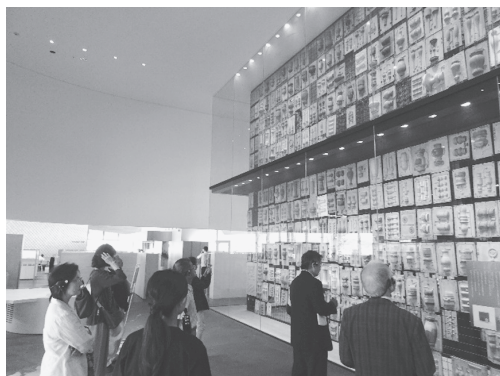
写真 15：鋳物型の「展示」兼「倉庫」

工場見学の前に能作の歩みを映像とともに分かりやすく解説した 10 分程度のビデオを視聴した。その中に能作が転換するきっかけとなるエピソードが紹介されていた。工場見学に来て職人の作業を見ていた親子の母親が息子である少年に「ちゃんと勉強しないとあんなふうになっちゃうよ」と話しかけていたこと、それを目の当たりにした能作 4 代目の現社長能作克治