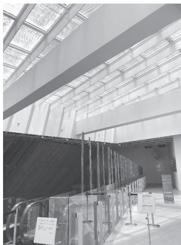
写真 11 : 富山キラリ最上階 : 天井からの光が階下へ降り注ぐ