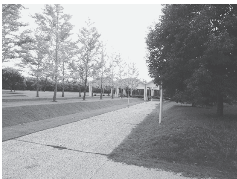
写真 8 : 広々と美しい YKK センターパーク内