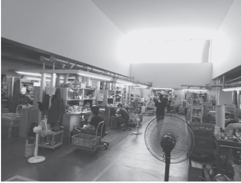
写真 17：はば広い採光口のある仕上げ場