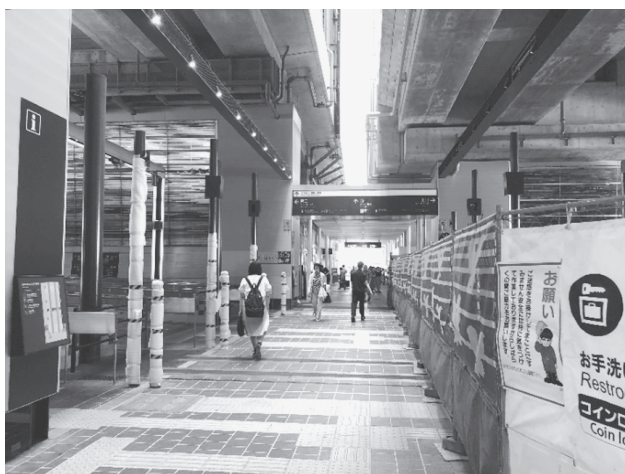
写真 12：左手は路面電車終点富山駅、右手は LRT への平面接続のために工事中

私たちは LRT に乗り換えて岩瀬浜を目指したが、時間短縮のため予定を変更して二つ手前の東岩瀬駅で下車し、岩瀬町通りを北上する形で北前船廻船問屋旧森家住宅を目指した。2018 年日本遺産に認定された岩瀬大町はかつて廻船問屋群が形成されていた北前船寄港地・船主集落であったところで、西に富山港を配したその古いまち並みは旧北国街道である岩瀬大町・新川通り沿いに面している。確かに歴史的には古いまちであるが、歩いてみると LRT 公共交通周辺活性化という市のコンセプトに依るものであろう、いたるところでまち並み修景のための歴史的建造物の保全や復元のための工事が行われていた。終了して間もないと思われる商業店舗や個人宅の建物も多く、また無電柱化、無電線化による道路空間の整備も進んでおり、古いまち