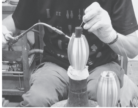
写真 18：間近に見ることができる仕上げ作業