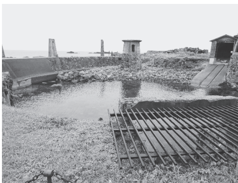
写真2：鉱石・資材を搬入した人工の港、大間港跡