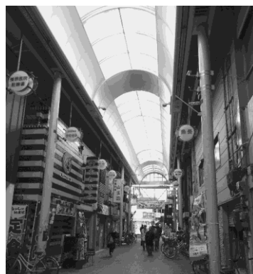
写真4：魅力的な地元天下茶屋商店街