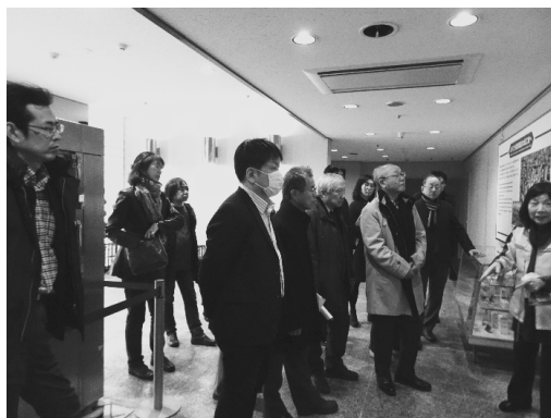
写真6：熱心な説明と説明に聞き入る参加者

15:00から工場見学となった（写真6）。案内されたのは1987年に竣工したというC70工場棟で、武田の固形剤の主力工場でもある。ここでは、原材料の供給から製剤、小分・包装、製品出荷の全てのラインがコンピューターによって運転・制御されている。フィルムコーティング錠や一般錠であれば一分間に4,000～6,000錠が生産されているようで、他にカプセル剤や顆粒剤が生産されていた。写真撮影は禁止であったが、通路からのガラス越しに原料を秤量する機械や混合機、製錠機、フィルムコーティング機などの全てを見ることが可能で、野路氏の軽快な大阪トークのリズムも手伝ってその製造工程をよく理解することができた。特に錠剤の検査と武田のシンボルウロコマークの印刷については驚かされるばかりであった。印刷に不備があれば、検査カメラとつながったコンピューターがチェックをして最後に除けてくれるのだという。この錠剤検査は1980年代まで目視で行っていたとのことで、見学コースに掲げられた検査を行う女性たちが写っている大きなパネル写真がその当時をよく物語っていた。現在の完全自動化の工場内では、働く人たちの姿は、1時間以上に及んだ私たちの見学中も時折その姿が見える程度であった。