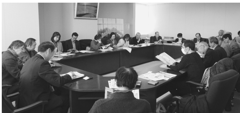
写真 5：西成区役所での質疑応答

続いて「西成特区構想」の説明では、バブル経済の崩壊後、求人数も日雇労働者数も大きく減少する中で失業し、あいりん地域内外で路上生活を余儀なくされたホームレスへの対応（生活保護利用による生活サポートは進んだが、生活保護受給率と単身高齢男性比率を高めた）と現在の課題（少子高齢化、不法投棄、治安、結核、野宿生活者）について説明していただいた。これに対して参加者からは、あいりんの名前の由来に始まり、特区構想に関わるコストや大阪都構想との関係について等さまざまな質問が出され、活発な議論が行われた（写真 5）。