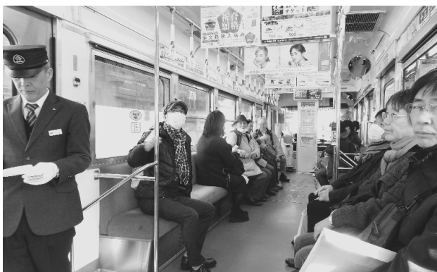
写真3：社研ご一行様貸し切りの阪堺電車内

ホテルロビーに8：50集合、9：00に阪堺電車の駅に向かって天王寺の街並みを見ながらの徒歩での出発となった。「新今宮」駅から阪堺電車に乗車し（写真3）、4つ目「北天下茶屋」で下車すると、西へ向かって魅力的な商店街（写真4）を抜け、さらに南海本線天下茶屋駅も突き抜け、15分ほど歩いて西成区役所に到着した。