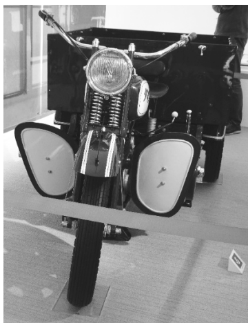
写真17：人気を博したダイハツ号 (HD型)

ダイハツは、近代工業化の進む1907年にエンジンの国産化を目指した「発動機製造株式会社」の設立に始まる。船舶用から出発して、その後農業、工業を支える企業としての志を持って発展してきたという。現在の自動車生産につながる最初の製造は、1930（昭和5）年に誕生した三輪自動車HA型ダイハツ号であった。「大阪にある発動機製造会社」という社名が略されて「ダイハツ」と呼ばれていたため、そのままそれを商品名にしたという。当時、道幅が狭く、町や家が密集している日本の実情にマッチしたものであったこと、特に小口荷物を運ぶ中小企業にとって使い勝手が良かったこと、さらに当時三輪自動車は運転免許が不要であったことも人気博す要因であったようだ。