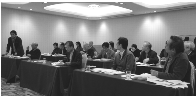
写真1：初日研究会の様子

14：00以降、今回全日の宿泊先となる天王寺都ホテルに参加者19名が次々とチェックインをし、17：00には全員がホテル5階の会議室に参集、2時間ほどの研究会が始まった。今回の実態調査の現地事前研究会である（写真1）。研究会の報告テーマは「大阪の産業構成の歴史的展開と地域的特性」、講師は大阪大学名誉教授の高山正樹氏をお招きした（写真2）。