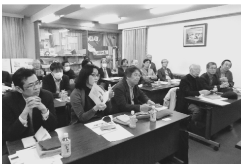
写真11：ヒアリングの様子

日根野のイオンモールで昼食休憩を取った後、一行は午前中に訪れたツバメタオルからは車で15分ほどのところにある泉佐野市南中樫井のダイワタオル協同組合に到着した。タオル協同