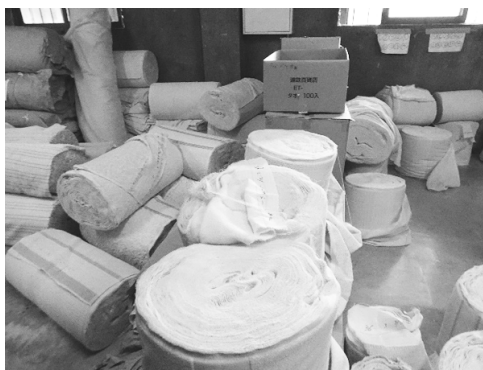
写真9：裁断前のタオル

再び会議室に戻ってからの重里氏のお話は、四国の今治タオルを意識された内容であり、それを比較的知り、理解できるという意味でも興味深いものであった。