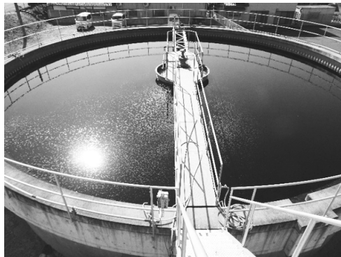
写真15、写真16：バクテリアによる汚泥活性処理の様子(屋上)