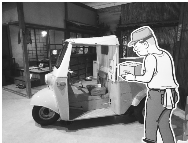
写真18：1957年発売ミゼット 小回り利く屋根付き三輪トラック

参加者の「懐かしい」という声がかしこであがっていたのが「いつの時代もくらしの真ん中に」の展示フロアである。戦後から現在までの各年代の身近なくらしの様子と、当時のダ