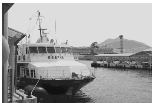
写真 15 BEETLE 号 (JR 九州ジェットフェリー)