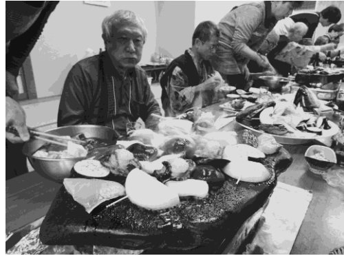
写真 26 石焼料理