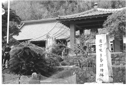
写真 18 円通寺