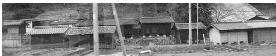
写真 24 高床式倉庫

バスはさらに南下して万関橋を渡った（写真 25）。日本海軍が明治 33 年、艦船の通り道として人工的に掘削した瀬戸にかかる橋で、これによって対馬は南北二つに、上島・下島とに分断されている。