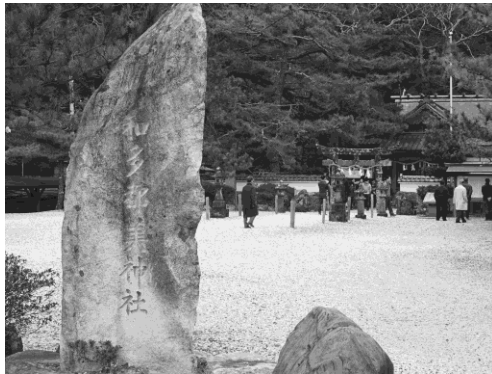
写真 21 和多津美神社①