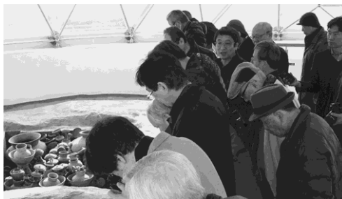
写真 14 福泉洞古墳群

次いで、国道 382 号線に入り南下して和多都美神社を訪ねた (写真 21)。ここは満潮時には神殿近くまで海水が満ちることから (写真 22) 竜宮が連想されて、海神にまつわる伝承がある。