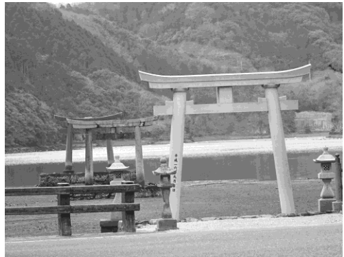
写真 22 和多津美神社②海中に続く鳥居