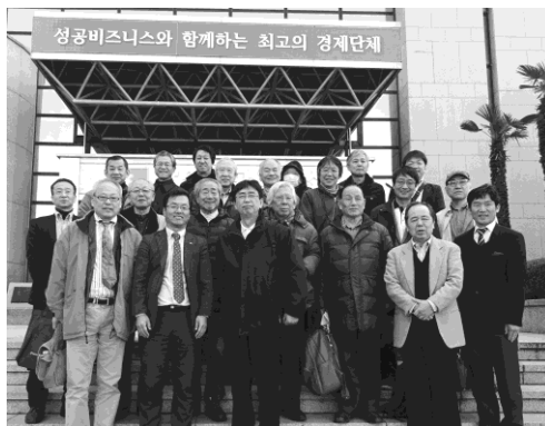
写真 5 昌原市商工会議所：集合写真