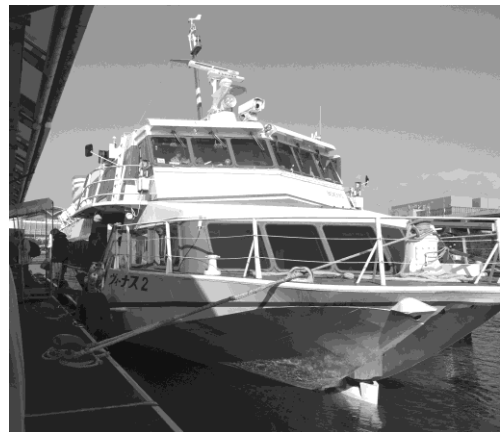
写真 29 ヴィーナス2 (九州郵船・ジェットフォイル)