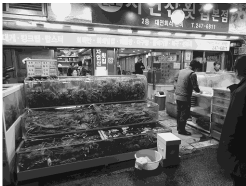
写真 2 結団式会場（海鮮居酒屋外観）

各自入室して一息ついたところで、社研実態調査恒例の結団式が地元魚市場そばの海鮮居酒屋（写真 2）で行われた。結団式（夕食）後は、これも恒例となっている参与を囲む会が開かれ、参与には大変お疲れのところ、無理をお願いして、社研の来し方・行く末について貴重なお話しの数々をうかがう機会をいただいた（写真 3）。社研事務局で構想が進んでいる『社研 70 年史』刊行についてご協力をお願いした。