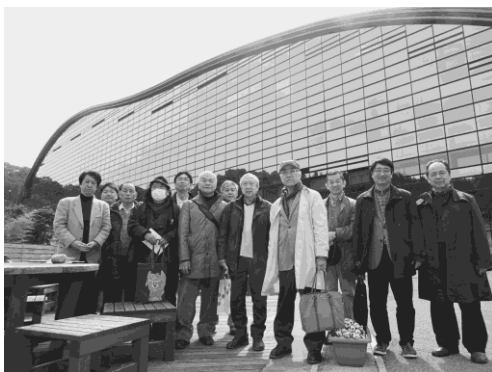
写真 33 九州国立博物館