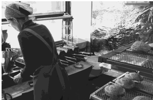
写真 19 永留菓子店の鯛焼き①