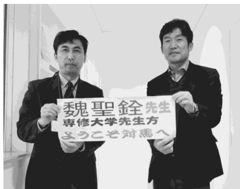
写真 16 対馬観光協会