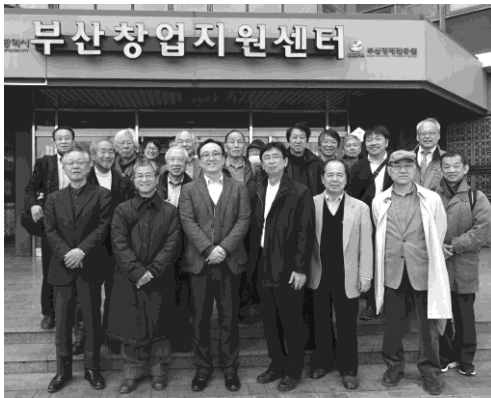
写真11 プギョン大学：集合写真