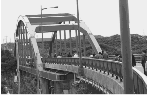
写真 25 万関橋