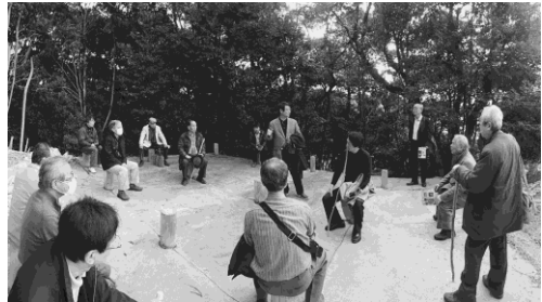
写真 27 金田城：掘立柱建物跡

2016年度春季実態調査現地研究会は、九州経済調査協会の調査研究部研究主査の島田龍