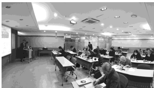
写真 4 昌原市商工会議所：レクチャー風景

午前中はまず、チャーターバスにて昌原市商工会議所を訪ね、同会議所の活動、昌原の対日貿易の現状についてうかがい、質疑応答