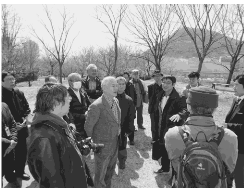
写真6 古代遺跡・鳳凰台

博物館を後にして、プキョン大学に向かった(写真11)。ここではまず、FABLAB釜山を訪ねた。FABLABはデジタルやアナログの工作ツール(最近では3Dプリンターなど)