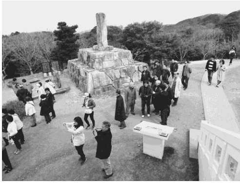
写真 17 韓国展望所