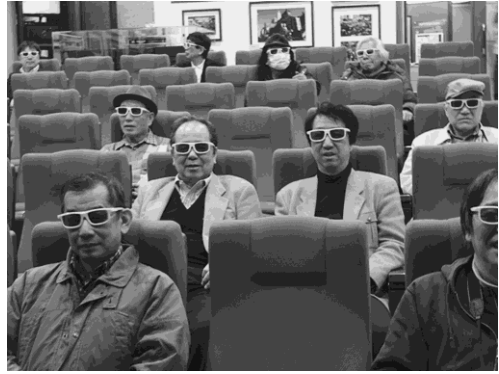
写真10 3D映像視聴@朝鮮通信使博物館