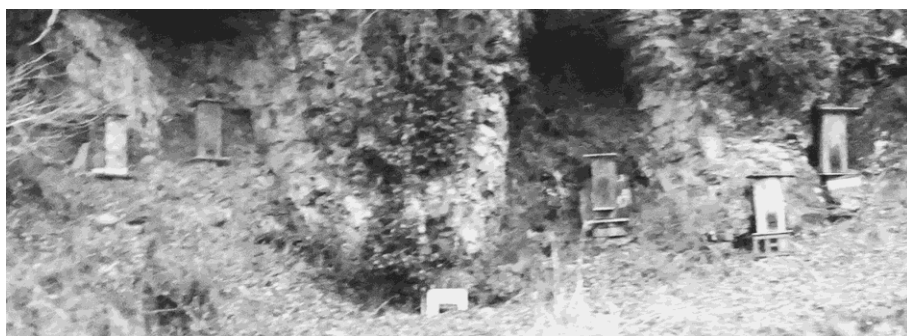
写真 23 日本蜜蜂の巣箱「蜂洞」

道中、集落を過ぎて次の集落に至る、崖縁のそこかしこに、木製の小さな塔を目にした（写真 23）。海辺の集落に置かれる海難供養塔かと思って眺めていたが、後にこれは対馬蜂蜜の巣箱であると教えられた。対馬は日本蜜蜂 100%の国産天然はちみつが採れることで有名で、この供養塔のように見えたものは、丸太をくりぬいた蜂の巣「蜂洞 はちどう 」であった。また、これも道中、至る所で目にした高床式倉庫（写真 24）。対馬ではこれに大きな板状の石で屋根を葺くのが伝統であるという。