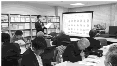
写真 1 事前学習