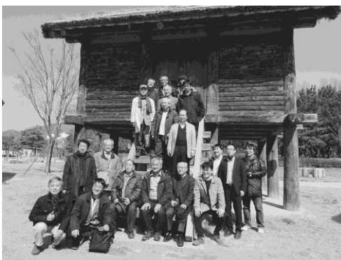
写真7 古代遺跡・鳳凰台：集合写真