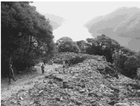
写真 28 金田城：国指定特別史跡