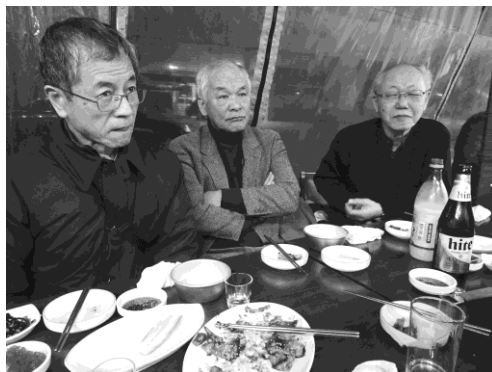
写真 3 参与のお話しに耳をかたむける