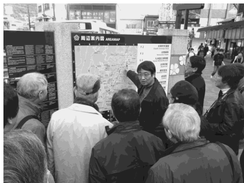
写真 32 太宰府視察