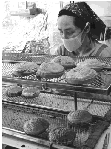
写真 20 永留菓子店の鯛焼き②