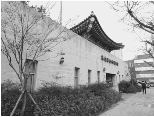
写真9 朝鮮通信使博物館