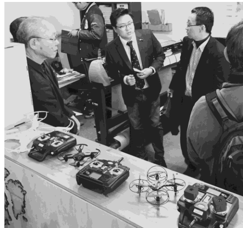
写真12 FABLAB 釜山