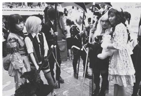
写真 ハノイでの日越外交関係樹立 40 周年を記念して「ジャパンフェスティバル」を開催された。コスプレを通じて、日本のマンガ文化を再現された。

2008 年以降、ベトナムのハノイ市とホーチミン市におけるアマチュアのコスプレ・グループが結成された。そのようなアパレルなどのビジネス製品、有名なマンガキャラクターの典型的なアクセサリにつながるので、若者の中で新しい消費文化をもたらしている。また、ベトナムの大都市における、マンガカフェ、オタク店、オタクケーキ屋などのマンガ文化に関する専門店も開かれている。