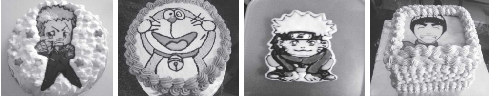
「Banh kem ITAKEIKI」という店のケーキの写真。 店の住所は 204/4b Quốc lộ 13, Phường 26, Quận Bình Thạnh, Ho Chi Minh

ベトナムの都市では子供向けに、ケーキにマンガの有名な登場人物を書いてある店が開発されている。