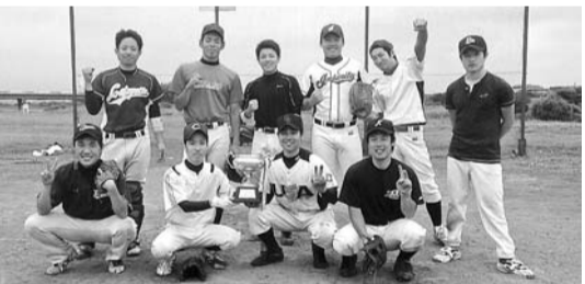
優勝した「横浜シークレッツ」

連合県人会が主催する「第48回川島正次郎杯争奪野球大会」の決勝戦が7月18日、川崎市高津区の宇奈根球場で行われ、横浜シークレッツがフ