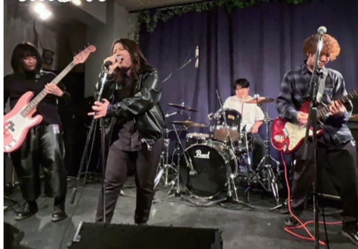
音楽活動を中心とした文化系サークル・現代芸術研究会が1月27日、石巻市のライブハウス「ラ・ストラーダ」でライブを開催した。3組のバンドが出演し、熱のこもった演奏を披露した=写真。

理工・辻准教授が参加の研究グループ ニホンザルの群れのつながり示す地図作成 (生息地の連結性)を示す地図を作成・公開した。