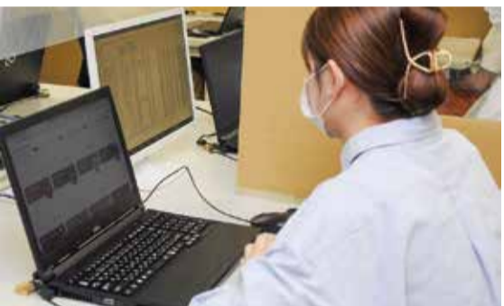
内容を、それぞれの学部学科で行っていく。さらに深く学びたい学生に対しては、SiDS関連科目群を用意しており、文系の学問とデータサイエンスの融合から新しい知の創出を目指す。

国際コミュニケーション学部のSiDS科目「日本語情報処理」では、言語のデータベースであるコーパスの分析スキルを身につける で、データ活用科目を多数設定。多くの学部学科ですでにさまざまな授業を展開してきた。今回はこうした強みを生かし、既存の科目をパッケージ化し、文系の初学者にも学びやすく、今後の専門教育につなげる SiDSは文部科学省「数理・データサイエンス・AI教育プログラム(リテラシー)認定制度」に対応する予定。