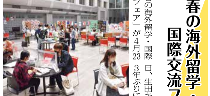
「春の海外留学・国際日、生田キャンパスで、交流フェア」が4月23、3年ぶりに対面形式で開催された。