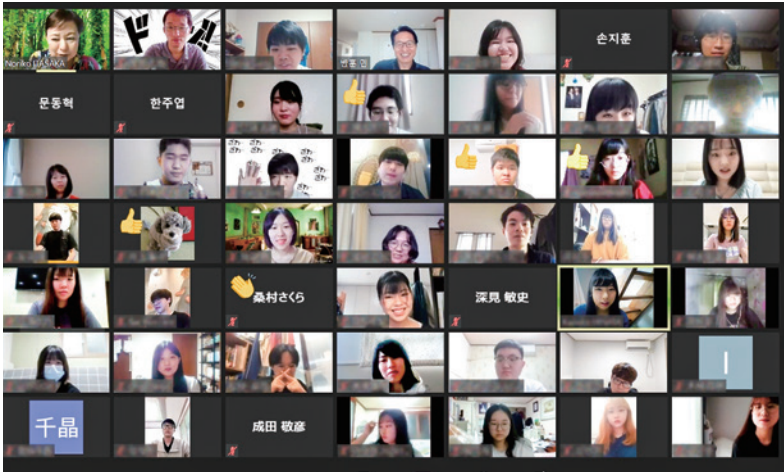
Zoomを介して意見を交わす両大学の学生