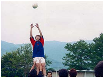
▲伊勢原グラウンドで熱のこもった練習