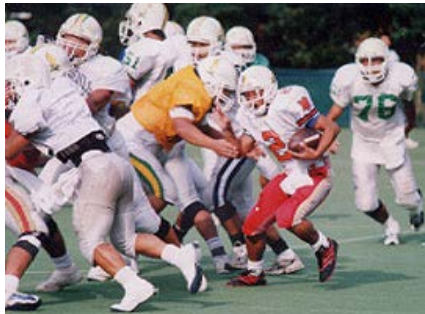
▲炎天下での気迫みなぎる練習

関東大学アメリカンフットボール1部リーグ戦が9月6日から開幕、熱戦が繰り広げられている。Bブロックの専大は9月7日、大井第2球技場で行われた立教大との初戦に28-7で勝利、4年連続プレーオフに向け好スタート。