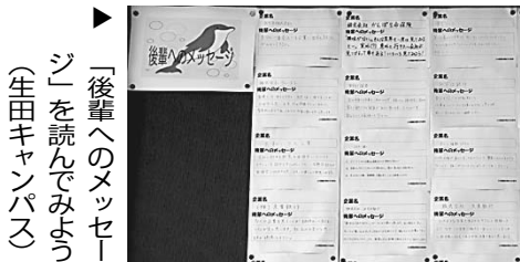
「先輩へのメッセージ」を読んでみよう(生田キャンパス)

採用試験の初期段階で行われるのが筆記試験。いくら面接(人物)重視といえども、筆記試験を通過しなければ面接に進むことはできない。なかでも全国6000社で行われるSPI試験の対策は必須。本格的な対策は必須。本格的な対策は必須。本格的な対策は必須。