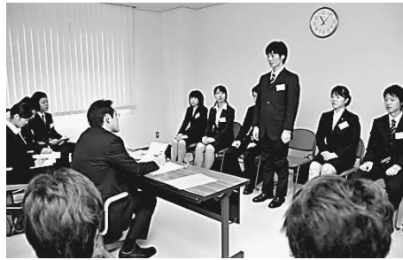
「総合就職合宿研修会」での模擬面接