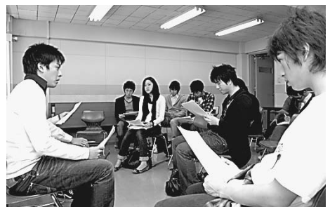
「内定者Cafe」でヒントを見つけよう