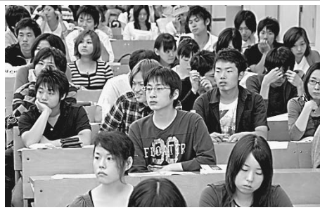
「第1回就職ガイダンス」でモチベーションを上げよう