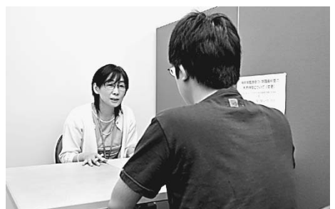
個別相談は予約不要