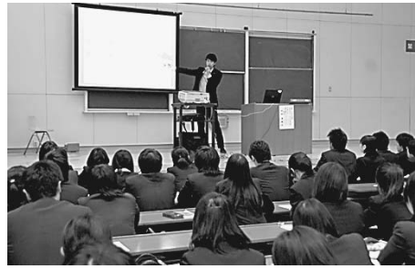
「業界・企業研究講座」は満席となる