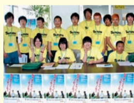
「私たち学生スタッフが皆さんをご案内します」