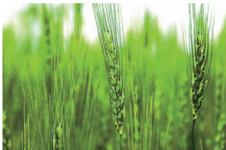
▲ 順調に成長している小麦「春よ恋」(第2農場で)

た、懇談後にホールに設置された展示販売コーナーで、専大ファーム産の加工食品を買い求める姿も見られた。参加者からは「個別面談などを通じて、親身になって指導していただいていると感じた」「子どもの現状を知ることができた」などの感想が寄せられた。 なお、10月11日(日)には「秋期父母懇談会」を開催予定している。