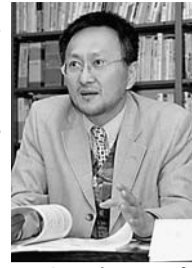
「基礎ゼミ」で進路について一緒に考えていきます。進路の手引き」という指導書を、1年次の前期から総合的に自分を見つめ直し、自己主張のできる力を身につけていきます。

教職員が一体となってきめてきたか。何が得意か」を細かに個人の目標に合った進路を考えさせることで、自分の強みを見つけて、将来の目標を見つけていくのが本学のキャリア指導の特徴です。みどりの総合科学科の「キャリア教育」となさい、「自分には何かないか」という科目では、入学時にアンケート用紙を配布し、卒業後、進路を問うことから将来を深く考えるヒントを与え、意識した学びがスタートします。商経社会総合科学科では、1人の教員が7、8人を担当する「基礎ゼミ」で進路について一緒に考えていきます。進路の手引き」という指導書を、1年次の前期から総合的に自分を見つめ直し、自己主張のできる力を身につけていきます。