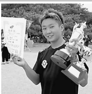
日本学生選手権・観音寺大会で