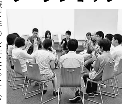
コミュニケーションの仕方学ぶワークショップ(生田キャンパスで)