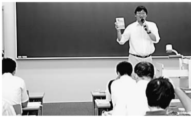
▲「ガンディーはファシズムにいかに対抗したか」(田中正敬教授)