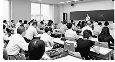
▲「光明皇后論—その実像と虚像—」(荒木敏夫教授)