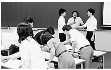
▲「教室指導へのまなざし」(田邊祐司教授)