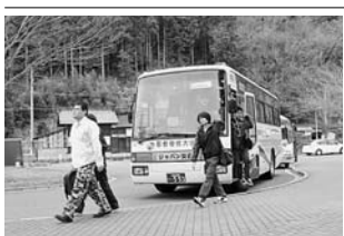
石巻市外からの通学も便利に

本学では「自宅通学支援バス」を運行し、乗車料金の一部負担や、石巻市外からの通学の支援を行っている。 従来の「石巻駅前〜大学の路線バス」「宮城県北部全川、築館、一関の3路線」大学の専用バス「仙台市内〜石巻市内