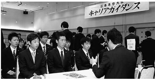
「就職支援」と「キャリア教育」の2本柱で学生をサポート

発表)と健闘した。今年度(2010年度)は、求人数は昨年度を若干上回っているが、内定率は昨年同様厳しい状況が続いている。本学では、進路支援係が実際の就職活動を支