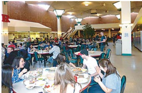
▲ ラトガース大学のカフェテリアで日本語を学ぶ学生たちと交流

しかし創立者たちが留学していたころは、日本との関係はまだ浅く、流ちょうな英語しか通じなかったはずですし、日米間は、今でこそ飛行機で12時間くらいですが、明治時代は船で何日もかけて渡航したのですから、とても苦勞したのだと思います。