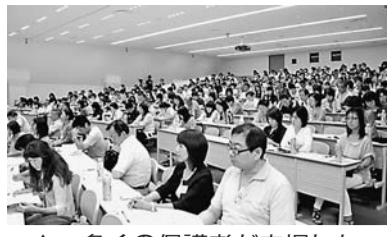
▲多くの保護者が来場した