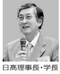
日高理事長・学長

神奈川東・西支部懇談会が7月29日、生田キャンパスで開かれ、ご父母・保護者ら411人が参加した。学生生活や就職活動に関する大学からの情報提供とパネルディスカッション、個人およびグループ面談、学内施設見学会が行われた。