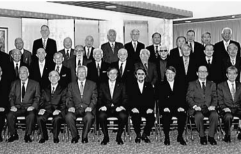
専修大学名誉教授称号記授与式が4月5日、神田キャンパスで行われた。

専修大学名誉教授称号記授与式が4月5日、神田キャンパスで行われた。この3月に定年退職を迎えた9氏に、日高義博学