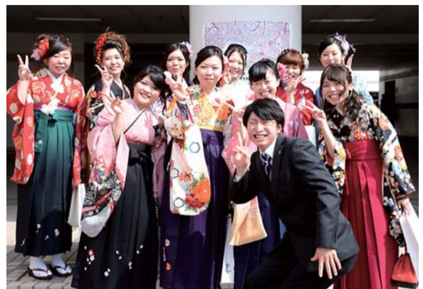
◀ 晴れやかな笑顔の卒業生たち

2014年度学位記授与式が3月20日、本学体育館で挙行された。大学院修了生、学部卒業生合わせて279人が学位を取得。希望を胸に新たな一歩を踏み出した。