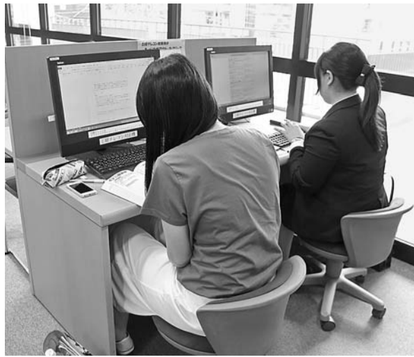
▲パソコンで企業情報の収集に励む(神田就職課)

採用に当たり、インターンシップを活用する企業が増える中、本学の学生の関心も高まっている。キャリアデザインセンターによると、14年度に大学を通してインターンシップに参加した学生は177人だった。学生