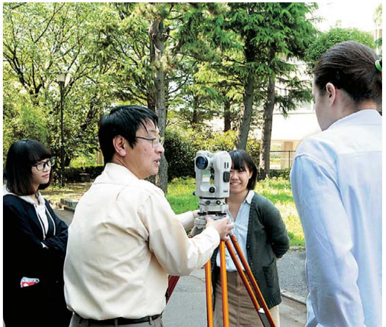
▲ 研究・調査に精力的に取り組む＝生田キャンパス1号館前