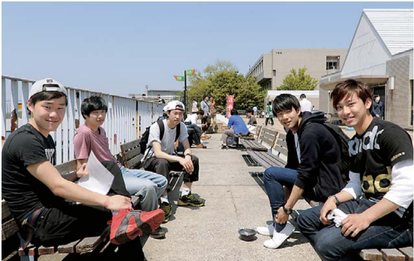
▲ 新年度スタートから1カ月。仲間とのぎずなも深まってきた＝生田キャンパス9号館屋上