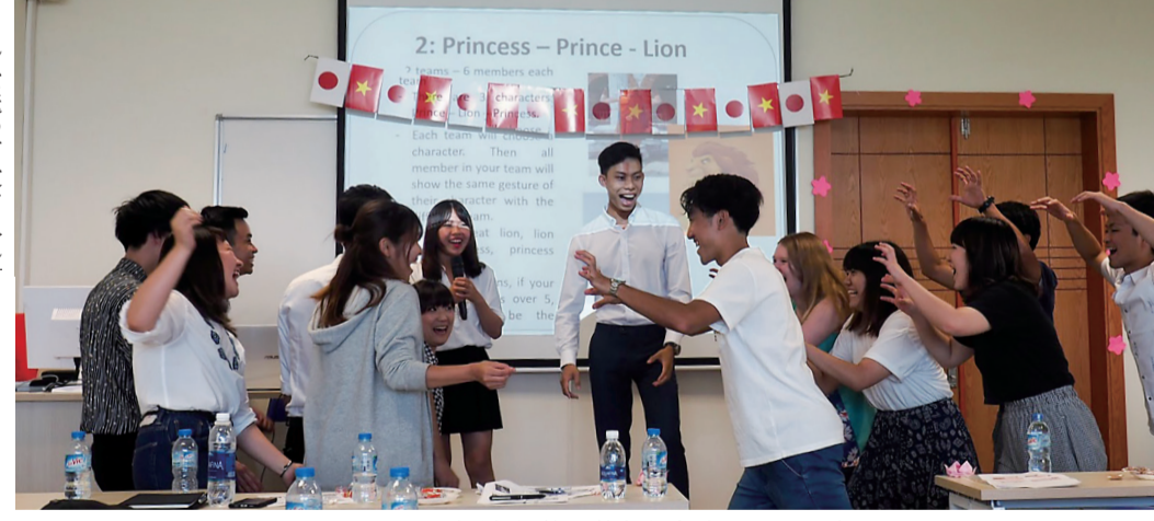
国民経済大学の学生と交流するゼミ生